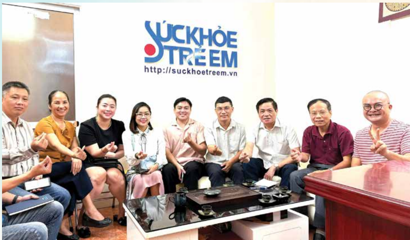
Ban biên tập tạp chí Sức khỏe Trẻ em và các cán bộ, phóng viên.

Các ban chuyên môn: gồm 11 đơn vị: (1) Ban Thư ký tòa soạn; (2) Ban Chuyên đề; (3) Ban Xã hội; (4). Ban Khoa giáo; (5) Trung tâm Media; (6) Trung tâm tư vấn pháp luật; (7) Ban Trị sự; (8).Trung tâm truyền thông; (9) Ban bạn đọc- Cộng tác viên; (10) Văn phòng đại diện phía Nam; (11) Văn phòng miền Trung, Tây nguyên./.