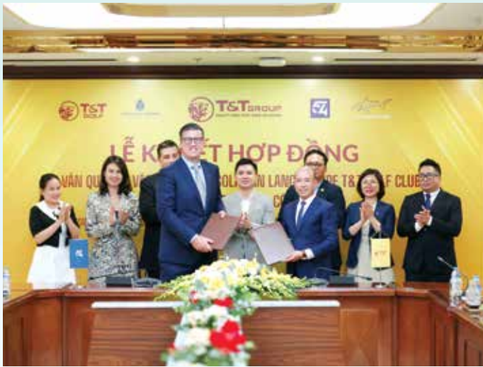
T&T Golf và 54 trao hợp đồng ký kết tư vấn quản lý vận hành sân golf

Công ty T&T Golf- Đơn vị thành viên của Tập đoàn T&T Group và Tập đoàn 54 đã chính thức ký kết thỏa thuận hợp tác tư vấn quản lý vận hành dự án Văn Lang Empire T&T Golf Club - sân golf đẳng cấp đạt tiêu chuẩn quốc tế “World Class”.