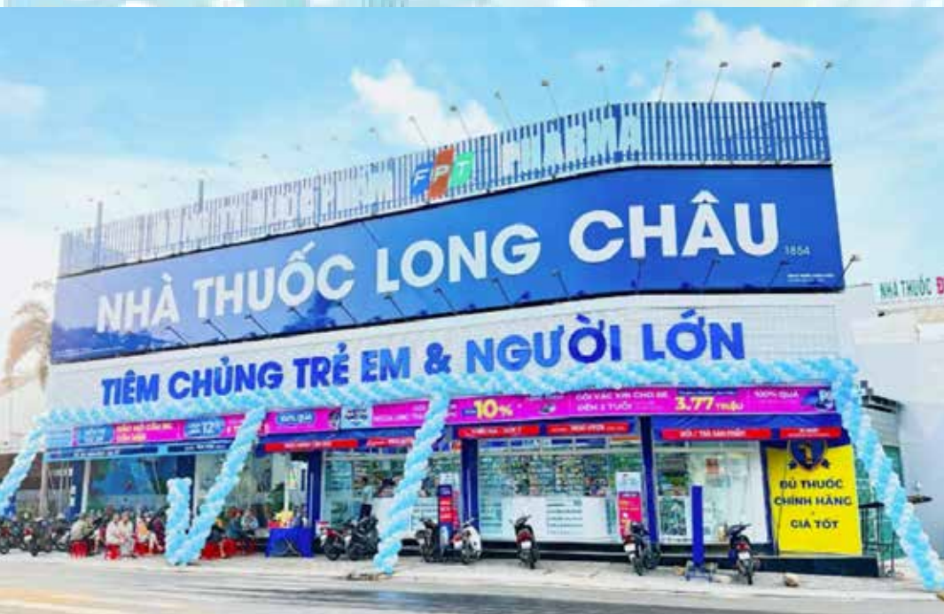
Mô hình trung tâm Tiêm chủng tích hợp bên trong Nhà thuốc Long Châu.

FPT Long Châu cũng luôn đồng hành cùng cộng đồng trong việc nâng cao kiến thức bệnh học, nhằm giảm gánh nặng về y tế, kinh tế cho người bệnh và xã hội. Không chỉ là những người tư vấn về thuốc, đội ngũ dược sĩ Long Châu còn cung cấp