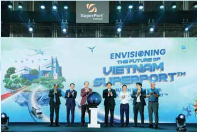
Các đại biểu thực hiện nghi thức công bố tầm nhìn mới của SuperPort™ Việt Nam.

Với mục tiêu đạt phát thải ròng bằng 0 vào năm 2040, SuperPort™ Việt Nam - liên doanh giữa Tập đoàn YCH (Singapore) và Tập đoàn T&T (Việt Nam) tổ chức sự kiện công bố Tầm nhìn mới của SuperPort™ Việt Nam.