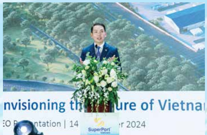
Các đại biểu thực hiện nghi thức công bố tầm nhìn mới của SuperPort™ Việt Nam.

SuperPort™ Việt Nam là cảng logistics đa phương thức có diện tích lên đến 83ha, nằm trên địa bàn tỉnh Vĩnh Phúc. Đây là liên doanh chiến lược giữa Tập đoàn YCH, nhà cung cấp giải pháp chuỗi cung ứng hàng đầu của Singapore với gần 70 năm kinh nghiệm dẫn đầu trong ngành, và Tập đoàn T&T (Việt Nam), nằm trong Top 10 tập đoàn kinh tế tư nhân đa ngành lớn nhất tại Việt Nam.