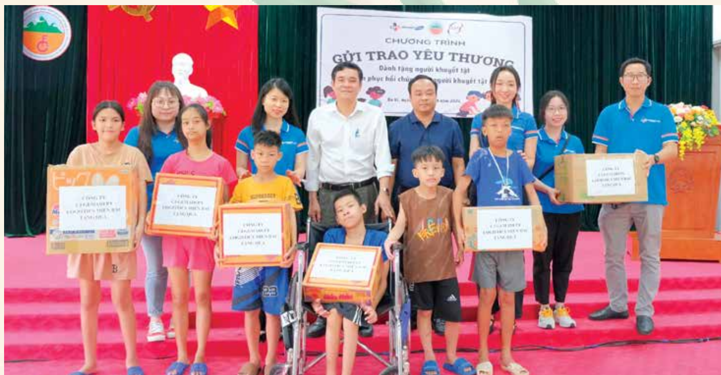
Đại diện GLCMB chi nhánh Bắc Ninh trao quà cho trẻ em khuyết tật tại Trung tâm Cứu trợ trẻ em tàn tật thị xã Thuận Thành.

vận hành từ tháng 11/2021 dựa trên nguồn phân bổ của chi nhánh miền Bắc, sự đóng góp của cán bộ, công nhân viên và các đối tác. Ngoài ra, nhân viên GLCMB còn nhiệt tình hưởng ứng và tham gia các hoạt động thiện nguyện khác như quyên góp ủng hộ trẻ em có hoàn cảnh khó khăn tại Thanh Hoá năm 2020, ủng hộ các gia đình bị COVID năm 2021, chủ động thực hiện những hoạt động thiện nguyện nhỏ trong doanh nghiệp như hỗ trợ các gia đình cán bộ nhân viên gặp hoàn cảnh khó khăn trong đợt bão Yagi vừa qua. Trong quý 4 năm 2024, GLCMB cũng đang dự kiến tiến hành xây dựng lại một điểm trường vùng cao bị bão Yagi tàn phá./.