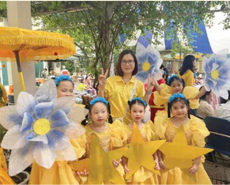
Cô giáo Nga giữa đàn em nhỏ thân yêu.

Phóng viên: Nhân ngày Phụ nữ Việt Nam (20/10) và sắp tới là Ngày Hiến chương các Nhà giáo Việt Nam (20/11), cô cảm nhận thế nào về vai trò của người phụ nữ trong lĩnh vực giáo dục đặc biệt?