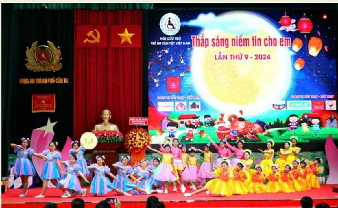
«Thắp sáng niềm tin cho em» lần thứ 9 - 2024.

Thứ năm, đẩy mạnh ứng dụng công nghệ thông tin hỗ trợ người khuyết tật tiếp cận chính sách. Hệ thống đăng ký, giải quyết chính sách trợ giúp xã hội trực tuyến đã được hoàn thiện và triển khai tại địa chỉ http://dvcbtxh.molisa.gov.vn . Hệ thống đã tích hợp 9 thủ tục hành chính trên Cổng Dịch vụ công Quốc gia. Thông tin định danh cá nhân của đối tượng được kết nối và xác thực thông qua CSDL Dân cư quốc gia. Hệ thống đã kết nối với hệ thống dịch vụ công một cửa điện tử. Đây là công cụ hỗ trợ để đối tượng hưởng chính sách trợ giúp xã hội thuận lợi kê khai thông tin cá nhân và gửi lên hệ thống để các cơ quan hành chính xem xét quyết định. Tiền trợ cấp sẽ được chi trả hàng tháng vào tài khoản của người thụ hưởng. Tuy nhiên đối với người khuyết tật, trẻ em khuyết tật chỉ được xem xét khi có đầy đủ thông tin về dạng tật, mức độ khuyết tật. Do vậy cần tiếp tục hoàn thiện hệ thống đăng ký theo hướng bổ sung hợp phần đăng ký xác định mức độ khuyết tật và cấp giấy xác nhận khuyết tật điện tử. Đồng thời tích hợp thông tin của người khuyết tật, trẻ em khuyết tật với các cơ sở dữ liệu khác và các hệ thống cung cấp dịch vụ công khác để thuận lợi trong tiếp cận chính sách và giảm thủ tục hành chính khi đối tượng phải thực hiện các thủ tục hành chính khác./.