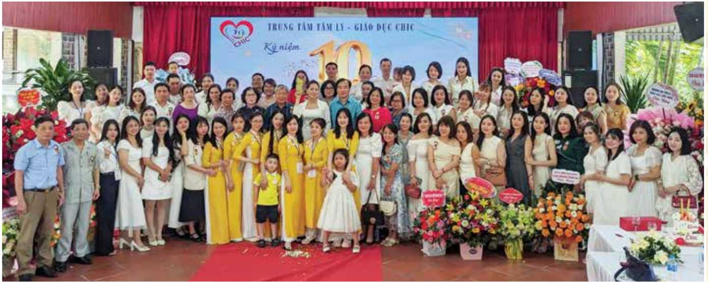
Tập thể lãnh đạo quản lý và cán bộ tại lễ kỷ niệm 10 năm thành lập Trung tâm CHIC.

Cơ sở vật chất, thiết bị dạy học được đầu tư bài bản. Mỗi phòng học đều được trang bị hệ thống chiếu sáng, trang thiết bị hỗ trợ đạt tiêu chuẩn, đặc biệt 70% đồ dùng can thiệp cho trẻ được cán bộ Trung tâm tự làm vào thứ 7 hàng tuần để tiếp cận đúng mục tiêu can thiệp, tạo cơ hội trẻ thực hành, trải nghiệm và khái quát hóa nội dung học tập.