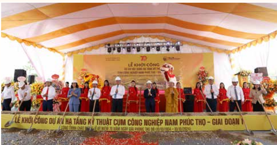
Lễ Khởi công dự án xây dựng hạ tầng kỹ thuật Cụm công nghiệp Nam Phúc Thọ.

Với mục tiêu “tiên phong phát triển cụm công nghiệp sạch”, đáp ứng xu hướng mới trong phát triển các khu công nghiệp, cụm công nghiệp ở nước ta hiện nay, CCN Nam Phúc Thọ - Giai đoạn I hướng đến xây dựng cộng đồng doanh nghiệp sản xuất tập trung, xanh, sạch với môi trường. Đồng thời, dự án cũng sẽ tạo động lực đổi mới công nghệ và nâng cao sức cạnh tranh cho các doanh nghiệp trong nước; thu hút nhiều doanh nghiệp trong và ngoài nước, từng bước thúc đẩy quá trình hội nhập kinh tế quốc tế của Việt Nam cũng như tăng thu ngân sách nhà nước. Dự án đi vào hoạt động sẽ tạo quỹ đất cho sản xuất công nghiệp tập trung, giải quyết công ăn việc làm cho người lao động, từ đó nâng cao thu nhập, ổn định đời sống nhân dân, khắc phục được tình trạng ô nhiễm môi trường bảo đảm an sinh xã hội.